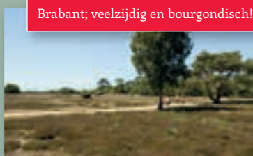
Brabant; veelzijdig en bourgondisch!