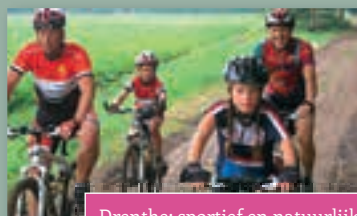
Drenthe; sportief en natuurlijk!