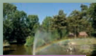
Limburg; onvergetelijk en mooi!