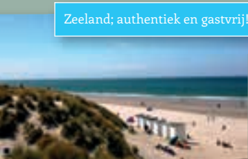
Zeeland; authentiek en gastvrij!