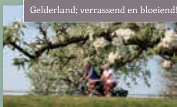
Gelderland; verrassend en bloeiend!