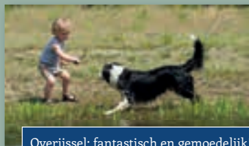
Overijssel; fantastisch en gemoedelijk!